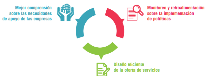
FIGURA 10. Potenciales beneficios para actores no empresariales e instituciones gubernamentales de pertenecer a un clúster