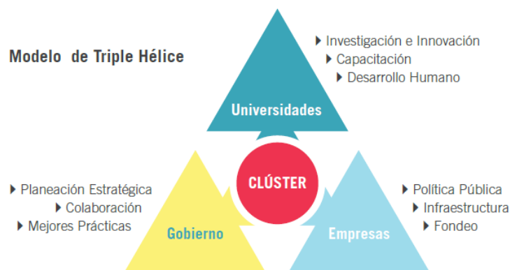
FIGURA 3. Triple Hélice: Modelo de la alianza pública-privada-academia