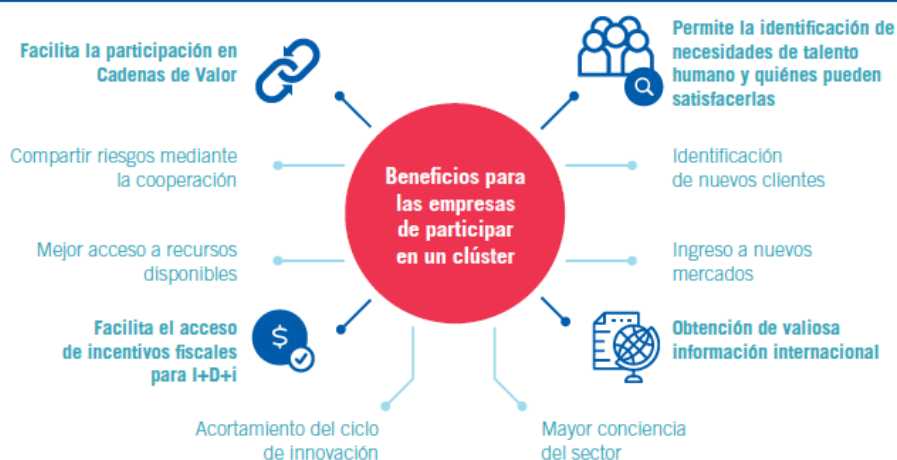
FIGURA 9. Potenciales beneficios que obtienen las empresas de participar en un clúster